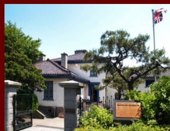
旧イギリス領事館