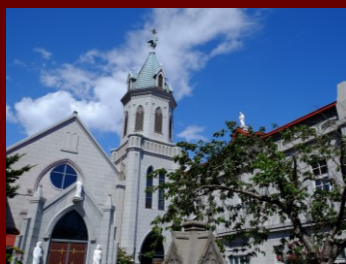
カトリック元町教会

大正12(1923)年建柱。2023年10月で100周年を迎えました。木製の電柱が主流だった時代に、耐火性や周辺環境との調和を考え、コンクリートで建てられた特別な電柱です。普段私たちがよく目にする電柱とは異なる角ばったデザインが目を引きま。隣には、もう1本同じ形の電柱が。2本あわせて「夫婦電柱」として、函館市民や観光客の皆さまに長年親しまれています。