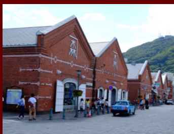
金森赤レンガ倉庫