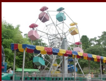
函館公園こどものくに 観覧車※