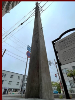
日本最古のコンクリート電柱 (函館市末広町15-1)