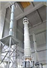
吉岡 ケーブル ヘッド