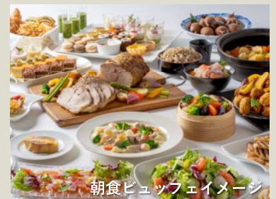
朝食ビュッフェイメージ

朝食は和食、洋食、中華料理を取り揃えたbuffet形式! 新鮮な海の幸をはじめ北海道の食をお楽しみいただけます