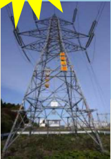
187kV IR吉岡線 鉄塔