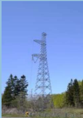
北斗今別 直流幹線 No.149