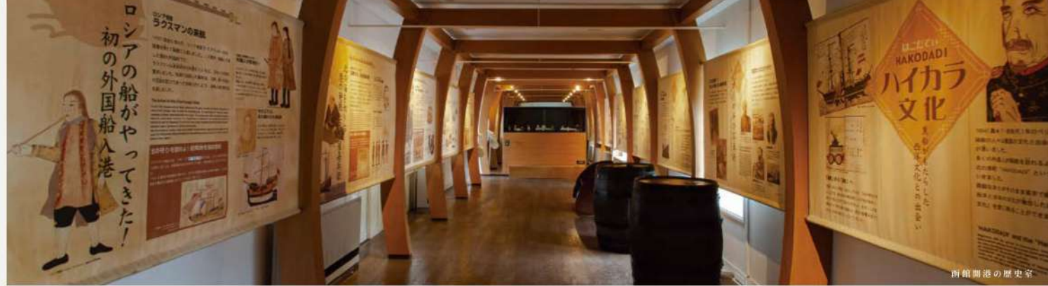
函館開港の歴史室

ペリー来航をきっかけに日本で初の国際貿易港として開港するまでの歴史や文化を展示パネルで紹介