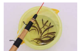
大沼 釣り イメージ図

どのプランも お一人様 平日 2000円分 土日祝 1000円分 ステイナビ電子クーポン を紙片で配布します