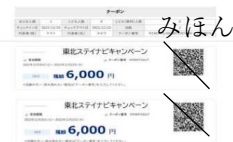
ステイナビ電子クーポン イメージ