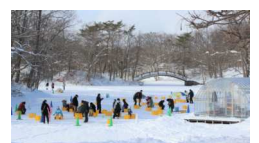
大沼国定公園氷上イメージ図