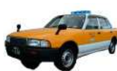
普通車 イメージ図