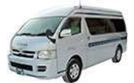
ジャンボタクシー イメージ図