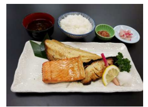
函館朝市栄屋 Bセット 焼魚定食