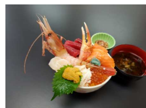
函館朝市栄屋 Aセット 海鮮丼