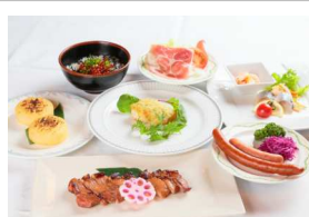
函館ビヤホール 函館山コース プラン1,2のお食事

※プラン2の観光は函館市内および函館市内近郊よりあらかじめお選びいただけます。担当者にご相談ください。