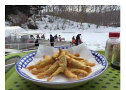
わかさぎ天ぷらイメージ図

日帰り旅行商品ですので、お渡しするクーポンの有効期限は当日限りです。また、プラン1~6へのお支払い時にクーポンはご利用いただけません。