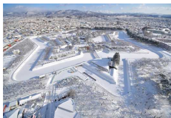
五稜郭公園(冬の雪)イメージ図