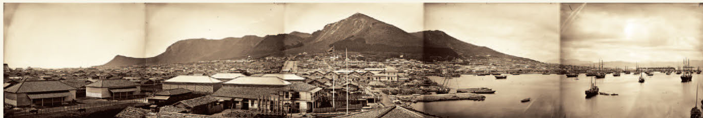
「函館山と函館市街」パノラマ写真 明治15年撮影

明治15年に発行された【函館真景】(浅野文輝・画)には、明治11・12年の大火からの復興の過程で大規模な街区整理と道路・坂の拡幅・直線化が進んだ函館の様子が美しい彩色で描かれています。———当時、函館山の麓・西部地区の町並みの骨格がほぼ出来上がり、今日に至っています。同時期に写真師・田本研造らが市街を撮影したパノラマ写真他、多くの写真が函館市中央図書館に収蔵されています。特に近年発見されたガラス原板によって極めて高精細の画像が得られるようになりました。———この「函館古地図マップ」は、【函館真景】に記された当時の建物などの様子を同時代の写真等で紹介。併せて現在の様子も重ねあわせることで、函館の歴史に関心をもつ皆様のガイドとなるようにしました。