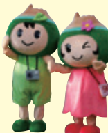
七飯町観光キャラクターポロくん ポントちゃん

アクセス / JR「函館駅」から ●JR「大沼公園駅」まで特急「北斗」で約30分、普通列車で約50分 ●函館バス「210系統」で函館駅から大沼公園まで約70分 ●車で28km、約40分 (函館新道、国道5号線経由)